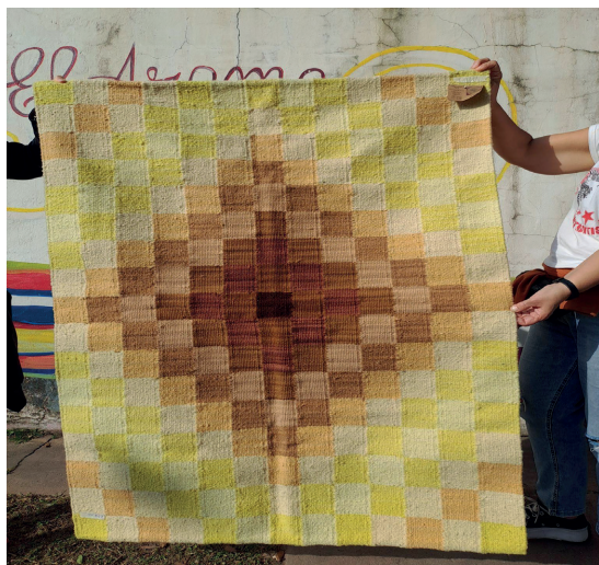
Trabajo de la Cooperativa El Aromo

arraigarán sus normas como parte del sentido de identidad de las personas. Las organizaciones entonces quedan atrapadas en rutinas y hábitos que son tanto psicológicos como prácticos, y que se incrustan en la memoria organizacional.