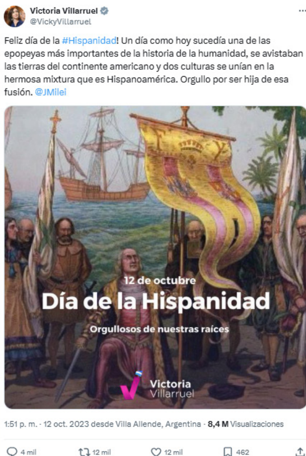
Imagen 1 Posteo sobre el 12O de Victoria Villarruel